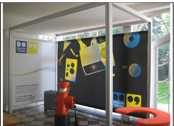
3: Modelstand 8m 2 (inclusief banner)

De stand - 4 m breed op 2m diep - heeft een modulaire structuur van aluminium profielen. De achterwand is geen panel maar een full print banner van 4 x 2,5m. U stuurt ons de grafische files voor deze visual en deze wordt door ons geprint en geplaatst. Na afloop van Design at Work neemt u de visual mee en is hij uw eigendom.