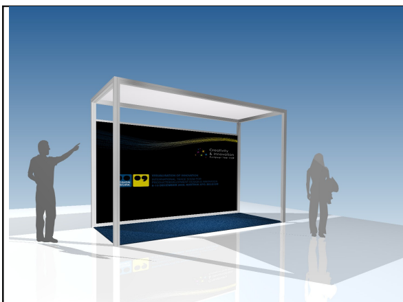
2: Rendering stand 8m 2